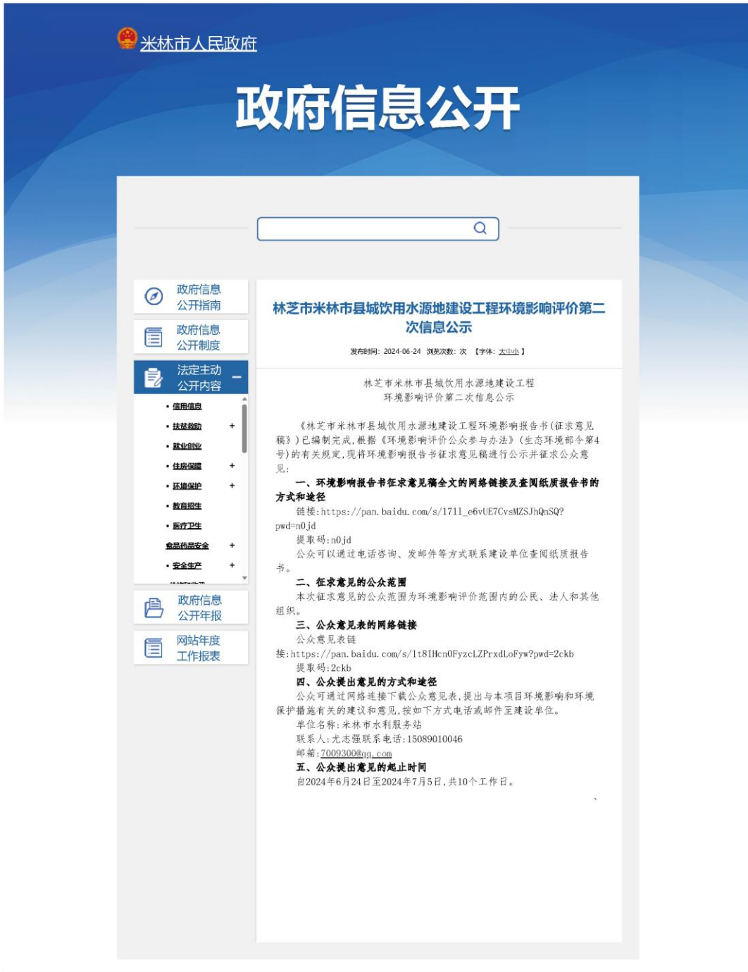
图 3.2-1 征求意见稿网站信息公开截图

征求意见稿信息公开选择的网站为米林市人民政府网站,符合《环境影响评价公众参与办法》中相关要求。